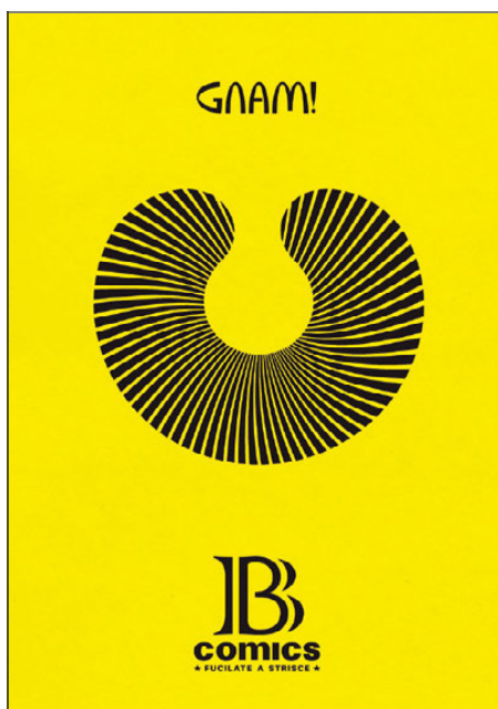
Immagini tratte dalla mostra di "B comics - fucilate a strisce" tenuta allo Studio Pilar (Roma, 10 giugno - 2 luglio 2016).

Druillet e Farkas, Moebius fondò Les Humanoïdes Associés (casa editrice specializzata nel fumetto e nella graphic novel) e con loro portò avanti la supremazia della forma, del disegno sul contenuto e sulla storia. Se da un lato Moebius rivoluzionò il modo di disegnare fumetti, dall'altro ogni disegnatore pensò di essere capace di scrivere le proprie storie, con risultati spesso e volentieri disastrosi (successe anche a Moebius, e ancora oggi assistiamo alla stessa cosa con molti graphic novel). Tanti, compreso Moebius, andarono a Canossa, ma editori e sceneggiatori avevano capito la lezione. Uno per tutti il già citato Charlier, che